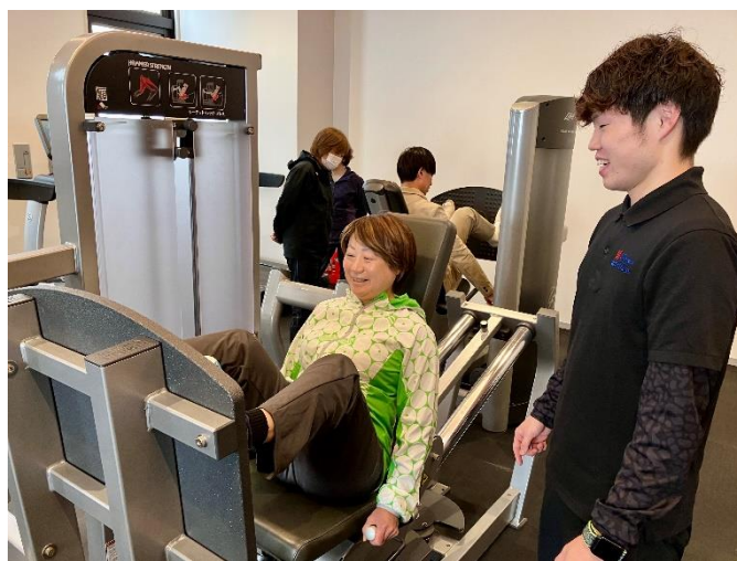
【村民のマシン体験】